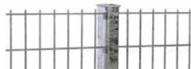
RANKO® Profilschienenpfahl lt. GUVV